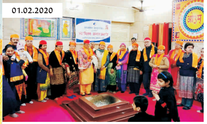
तारा संस्थान, उदयपुर द्वारा आर्य समाज मंदिर, रेलवे रोड, शकूर बस्ती, दिल्ली 34 में एक स्नेह मिलन – सम्मान समारोह का आयोजन किया गया।