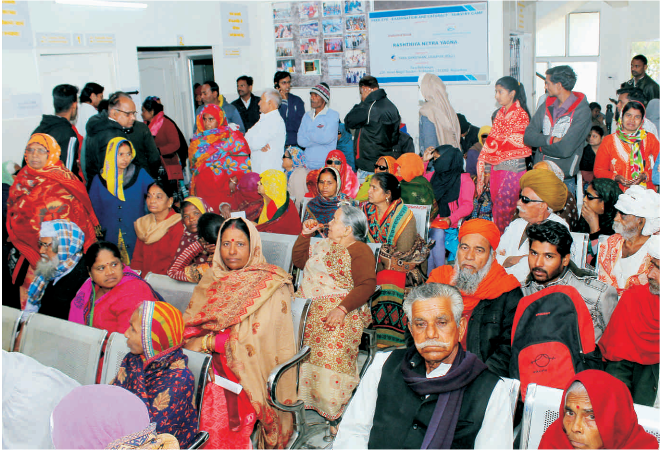
ओ.पी.डी. में अपनी बारी का इंतजार करते मरीज

तो आइए, ऑपरेशन का मौसम तारा नेत्रालयों में किस प्रकार से मैनेज किया जाता उसे अगले पृष्ठों पर फोटो स्टोरी के माध्यम से समझते हैं: