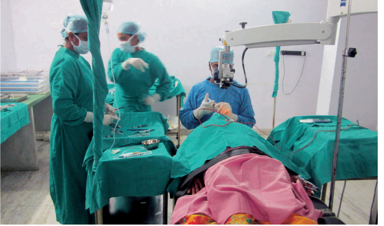
ऑपरेशन होते हुए एक दृश्य