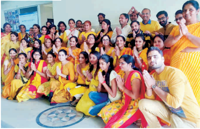
तारा संस्थान में बसंत पंचमी उत्सव दृश्य